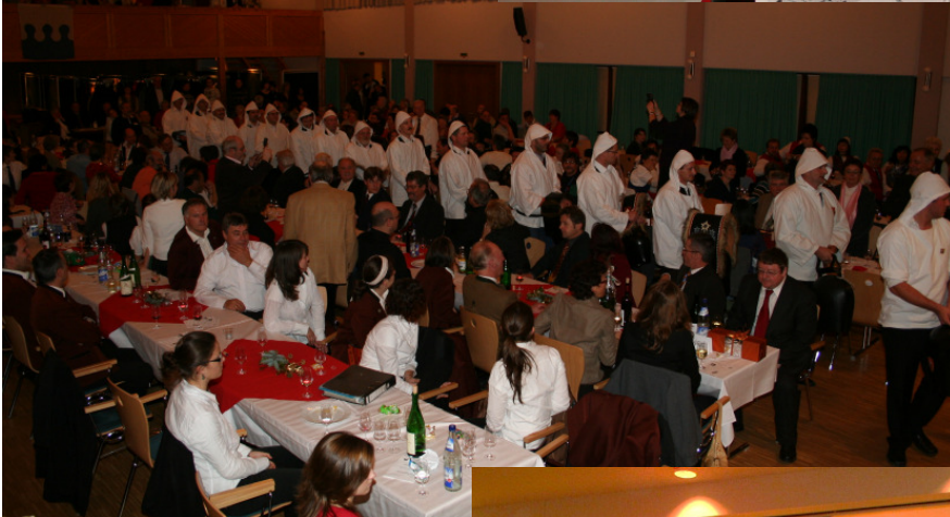
Einzug der Trinkler in die Stadthalle. (Mitglieder des Jodlerklubs Heimelig)