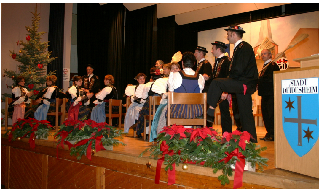
Trachten- gruppe Buochs