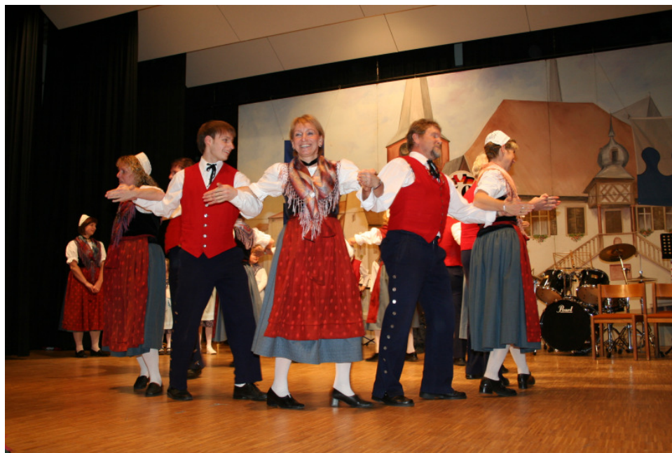
Trachten- und Volkstanzgruppe Deidesheim